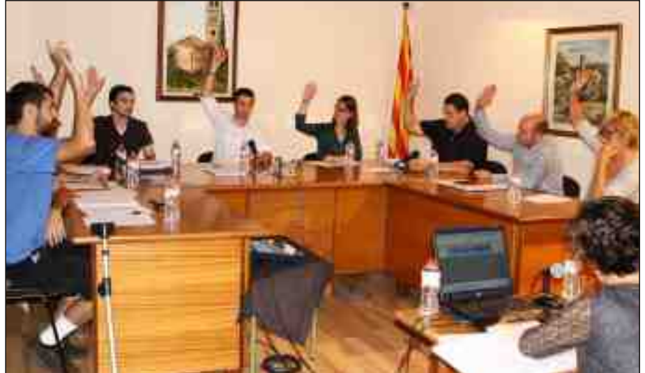
El ple va aprovar provisionalment el POUM al setembre passat, per unanimitat

El procés d'elaboració del POUM de Sant Vicenç ha estat més llarg