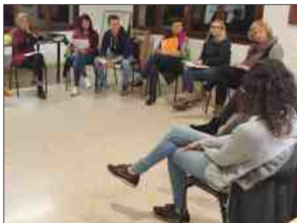
Presentació del programa pedagògic Ens Mengem les Valls , i a la dreta, primera sessió dels Espais de Debat Educatiu

L'Ajuntament vol donar valor a l'educació dels nens i nenes del municipi i per això treballa conjuntament amb els dos centres escolars. Es col·labora econòmicament en diferents projectes pedagògics, com Ens Mengem les Valls , promogut pel programa Leader, per acostar als infants els productes de proximitat i els beneficis del seu consum.