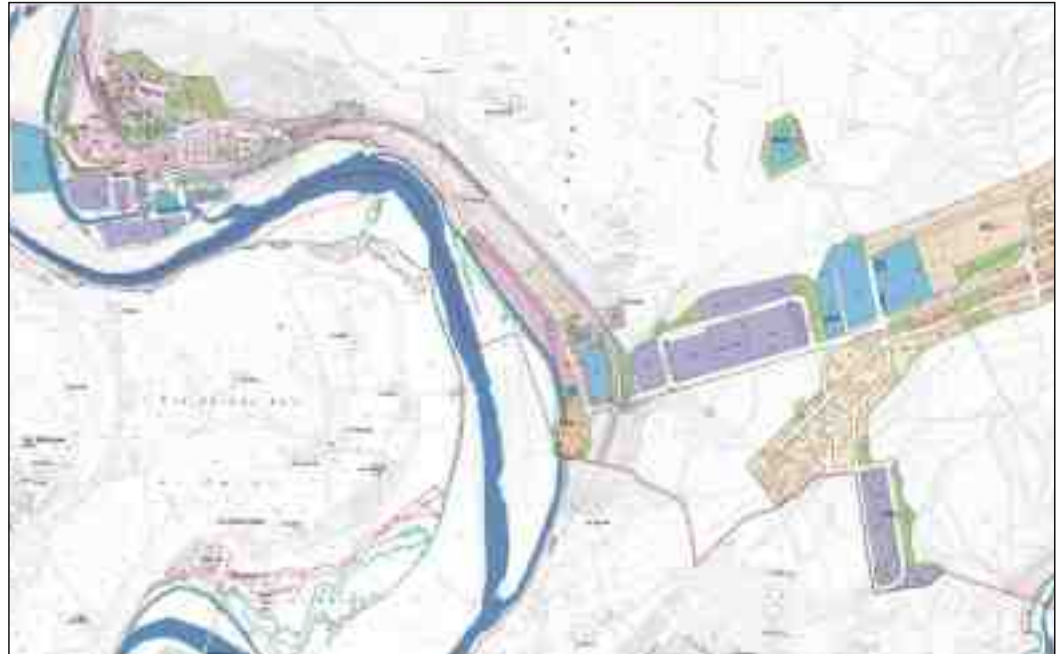
Un dels plànols del POUM que dibuixa les taques de creixement per als propers anys

L'any que acabem de deixar enrere és el que ha fet 200 de la història del nostre poble tal com avui el coneixem. Va ser per una real resolució del 8 d'agost de 1806, després que un any abans els veïns de Sant Vicenç s'adrecessin al rei Carles IV per denunciar que compartir municipi i batlle amb Sant Pere, com passava des de 1630, s'havia fet insostenible. Aquell nucli de població no tenia res a veure amb el que existia el 1626, quan amb prou feines hi havia quatre famílies vivint al voltant de l'església. Havia crescut i havia anat adquirint una personalitat pròpia que feia cada vegada més difícil assumir la dependència de Sant Pere. Com explicava l'historiador Pere Colomer en el prospecte que aquest 2006 recordava el bicentenari de Sant Vicenç, el 1805 es va començar a desencadenar tot. En la carta adreçada al rei, els vilatans deien que de la unió amb Sant Pere se'n derivaven "gravísimos inconvenientes y perjuicios a los vecinos (...) por las continuas discordias, que sin arbitrio para zanjarlas se experimentan entre los vecinos". La demanda va ser satisfeta i Sant Vicenç era, un any després, municipi independent.