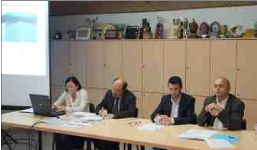
Representants de la Diputació en la xerrada en què es va presentar el projecte

El polígon industrial i la zona escolar i esportiva tindran aviat accessos més segurs des de la carretera de Vilaseca