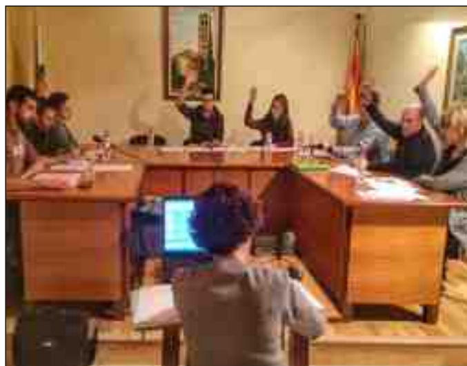
Els vots de l'equip de govern van aprovar el pressupost

A nivell social es mantenen les despeses de servei a les famílies, com també els diferents tipus d'ajudes. Es mantenen, també, totes les subvencions a les entitats del municipi.