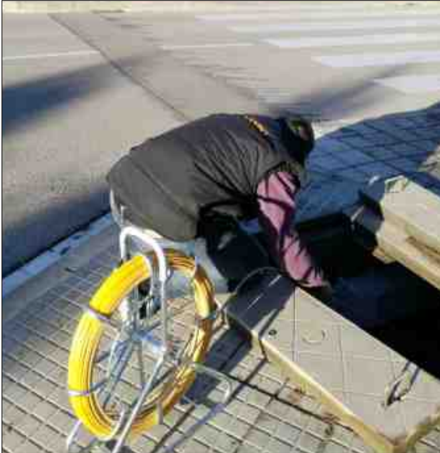
Un operari treballant en la instal·lació del cablejat per a la fibra òptica

Aquest final d'any ha començat el desplegament, que a l'abril arribarà a tot el poble